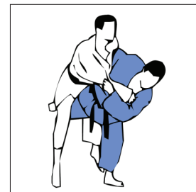
UCHI MATA FAUCHAGE PAR L'INTÉRIEUR DE LA CUISSE

ASHI WAZA (JAMBES) OU KOSHI WAZA (HANCHE)