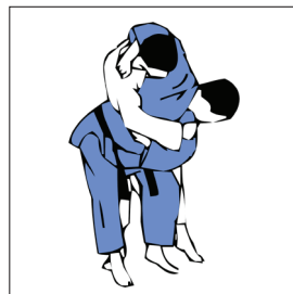
KOSHI GURUMA ROUE AUTOUR DE LA HANCHE

ASHI WAZA (JAMBES) OU KOSHI WAZA (HANCHE)