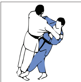
OKURI ASHI BARAI BALAYAGE DES DEUX PIEDS EN DÉPLACEMENT