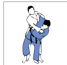
HANE GOSHI HANCHE SAUTÉE