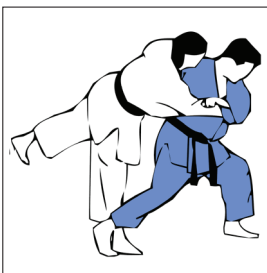
TAI OTOSHI RENVERSEMENT DU CORPS