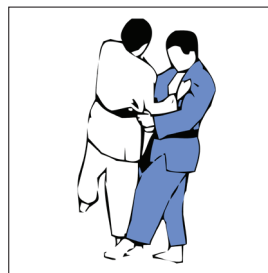
KO SOTO GARI PETIT FAUCHAGE EXTÉRIEUR